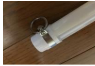
上記リングは、オプション(単価は同じ)