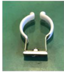
マグネットホルダは別売り