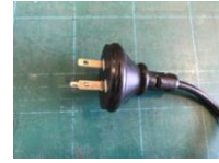
ケーブル先端 一体型防水プラグ付き